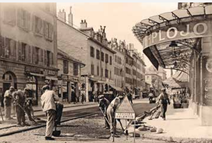
Fabrication d'un revêtement bitumineux constitué de deux couches («Mexphalte») dans la Rue de Carouge, à Genève, en 1927.