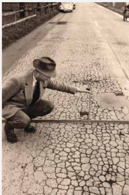
Les dégâts sur la route principale Berne-Thoune en 1947 montrent une situation fréquente dans l'après-guerre: sur de nombreuses routes, l'assise de chaussée et le revêtement s'effondrent. Une raison suffisante pour lancer un projet de recherche.